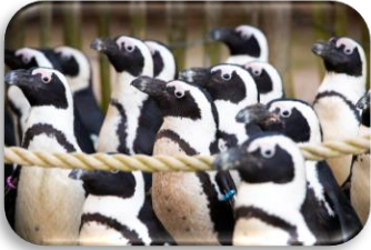
Afrikaanse pinguïn Spheniscus demersus