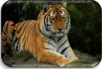
Amoertijger Panthera tigris