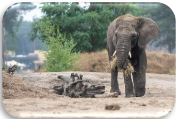
Afrikaanse olifant Loxodonta africana