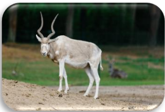
Addax Addax nasomaculatus