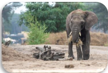
Afrikaanse olifant Loxodonta africana