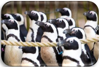
Afrikaanse pinguïn Spheniscus demersus